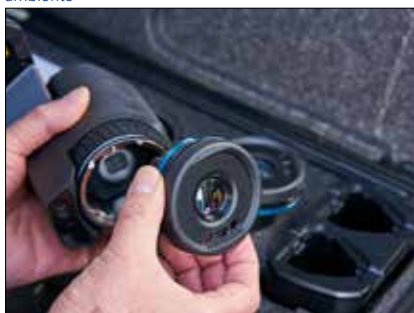
Condividete gli obiettivi (da grandangolo a teleobiettivo) con la vostra dotazione di termocamere, grazie alle ottiche AutoCal™