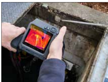
Il blocco ottico orientabile a 180° e il luminoso LCD da 4" rendono la Serie T500 facile da utilizzare in qualsiasi ambiente