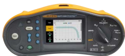
Registrazione dei dati